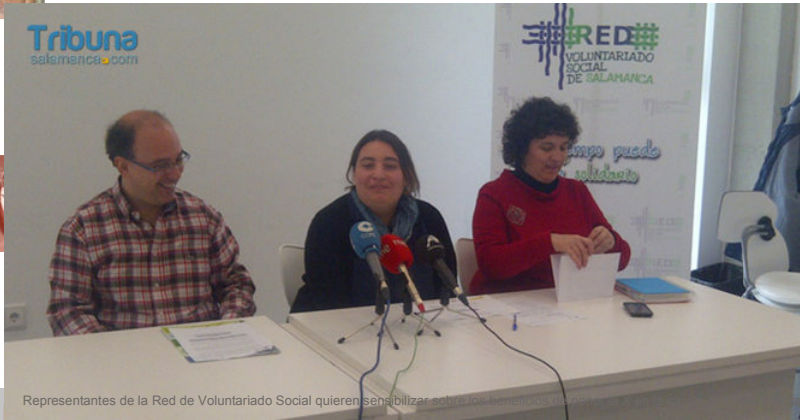
Representantes de la Red de Voluntariado Social quieren sensibilizar a los contribuyentes